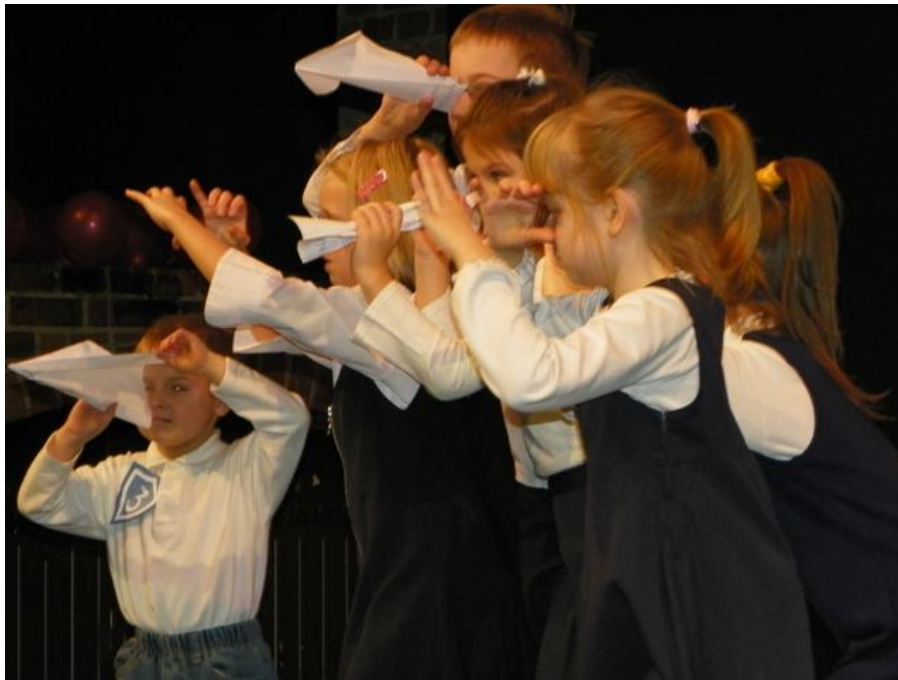
Zespół MAŁY TEATR POSZUKUJĄCY z Ośrodka Kultury w Wesolej Spektakl pt: „Pierwszy dzwonek”