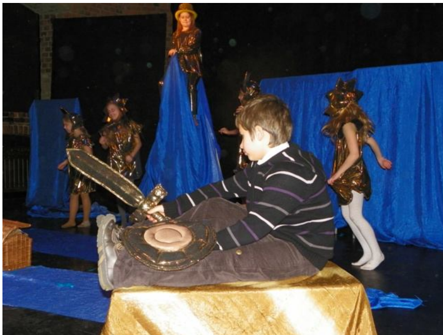
Zespół ŚWIETLICZAKI ze Szkoły Podstawowej nr 50 w Warszawie Spektakl pt.: „Dwie syrenki”