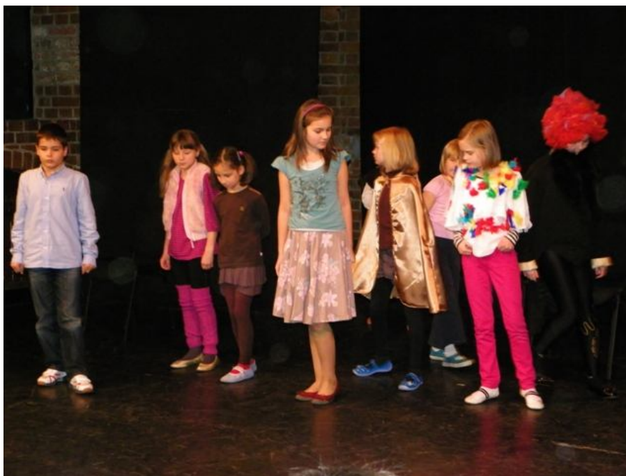
Zespół ŚWIETLIKI Z AKADEMII z Klubu Kultury „Radość” w Warszawie Spektakl pt.: „Szkoła Przyszłości, czyli przygoda z Akademią”