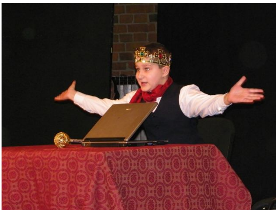
Zespół ŚWIETLICOWE KOŁO TEATRALNE z Biblioteki dla Dzieci i Młodzieży nr XXX w Warszawie Spektakl pt.: „Zawierucha w Karlandii”