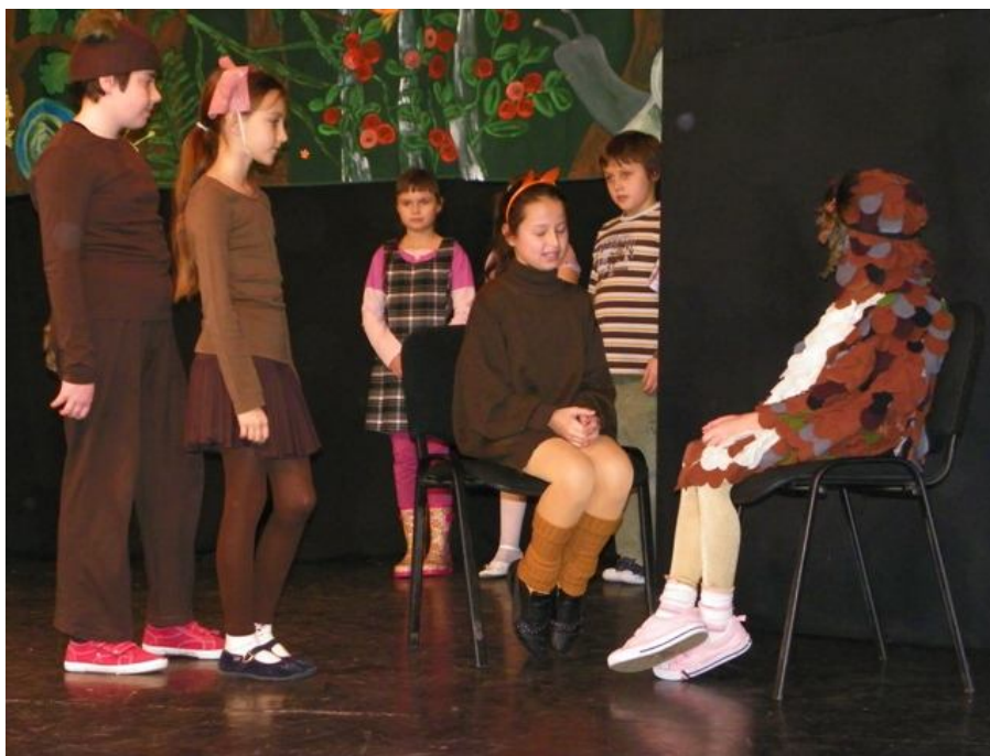
Zespół KLASA III B ze Szkoły Podstawowej nr 321 w Warszawie Spektakl pt.: „Leśne tajemnice”