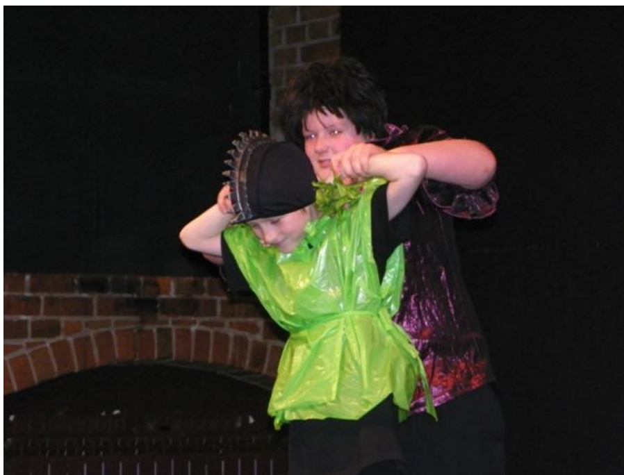
Zespół TEATR Z PIWNICY ze Szkoły Podstawowej nr 2 w Podkowie Leśnej Spektakl pt: "Smok Kuba"