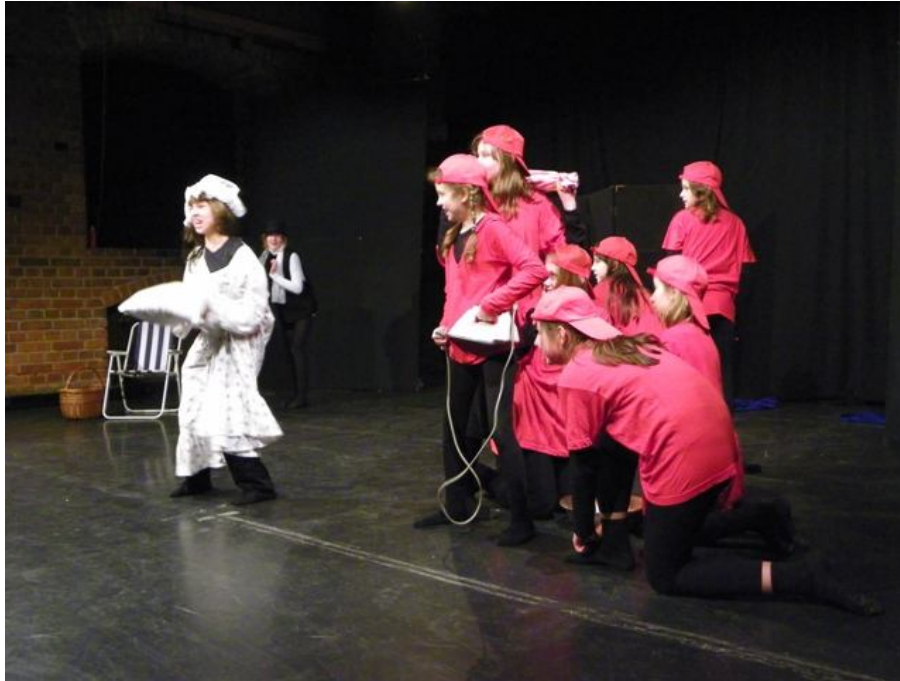
Zespół TEATR HORROREK ze Szkoły Podstawowej w Nowej Iwicznej Spektakl pt.: „Kabaret Horrorek”