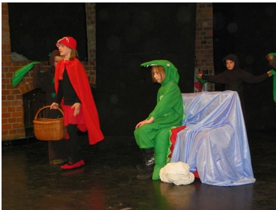
Zespół TEATR PROJEKT 72 z Niepublicznej Szkoły Podstawowej nr 72 w Piasecznie Spektakl pt.: „Bałagan w bajkach”