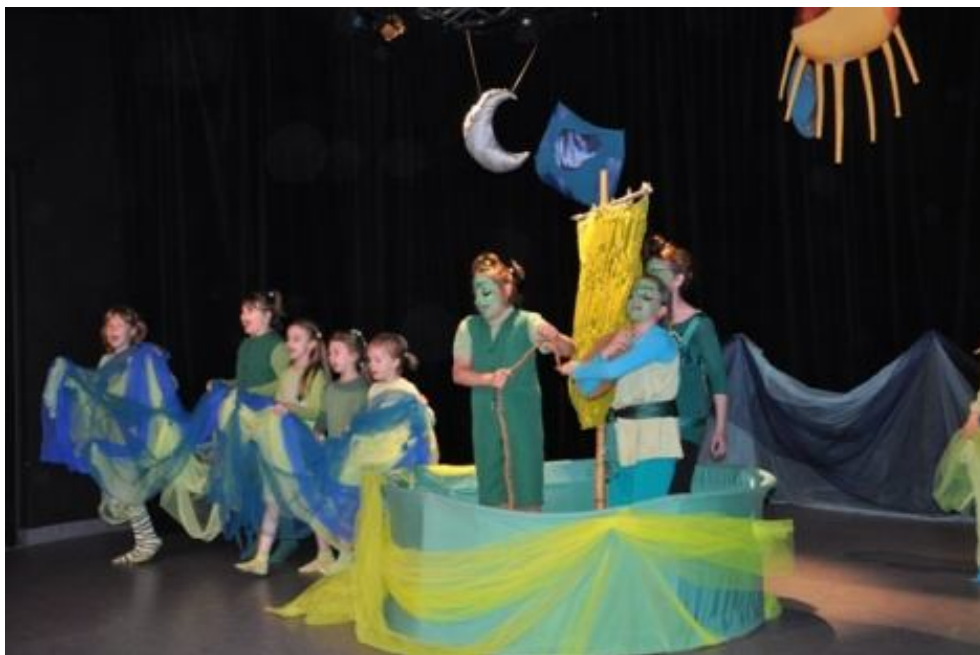
Zespół GRUPA TEATRALNA SPOD ZNAKU KRÓLA MACIUSIA - MUZYCZNY TEATR MŁODYCH BIAŁA MANDRAGORA z Młodzieżowego Domu Kultury w Płocku Spektakl pt.: „O żeglarzach Dżamblach”