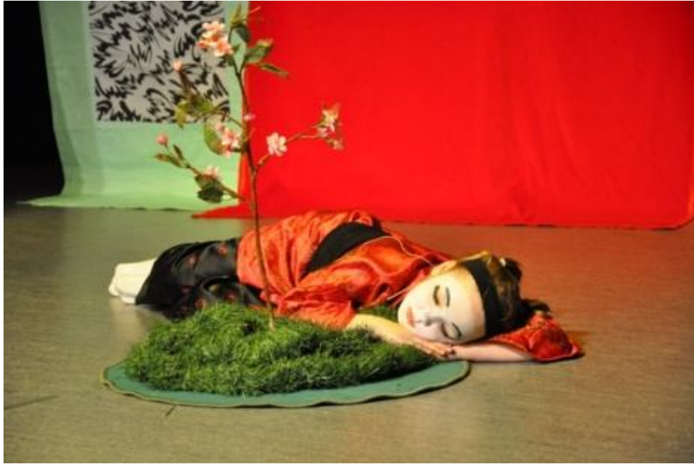
Zespół GRUPA TEATRALNA PRZY SZKOLE PODSTAWOWEJ 112 ze Szkoły Podstawowej nr 112 w Warszawie Spektakl pt.: „Cudowna pestka”