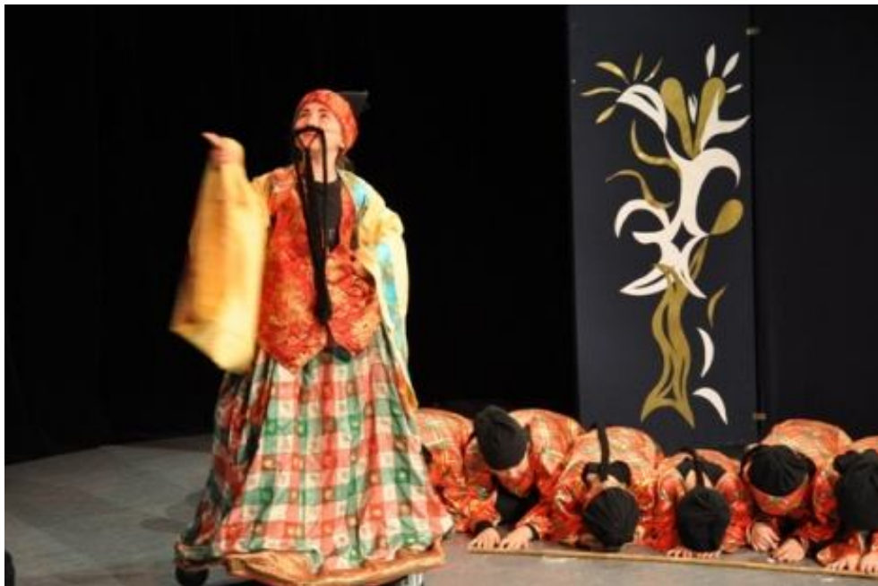
Zespół KOŁO TEATRALNE JÓZEFINKI ze Szkoły Podstawowej im. Józefa Jagielskiego w Międzyborowie Spektakl pt.: „Czarodziejski śpiew”