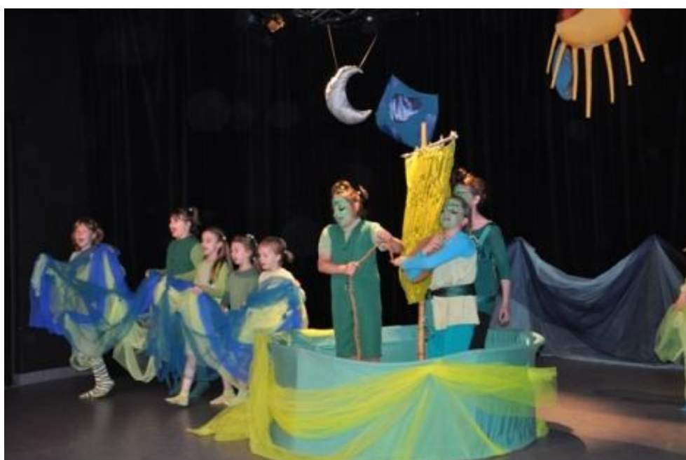
Zespół GRUPA TEATRALNA SPOD ZNAKU KRÓLA MACIUSIA - MUZYCZNY TEATR MŁODYCH BIAŁA MANDRAGORA z Młodzieżowego Domu Kultury w Płocku Spektakl pt.: „O żeglarzach Dżamblach”