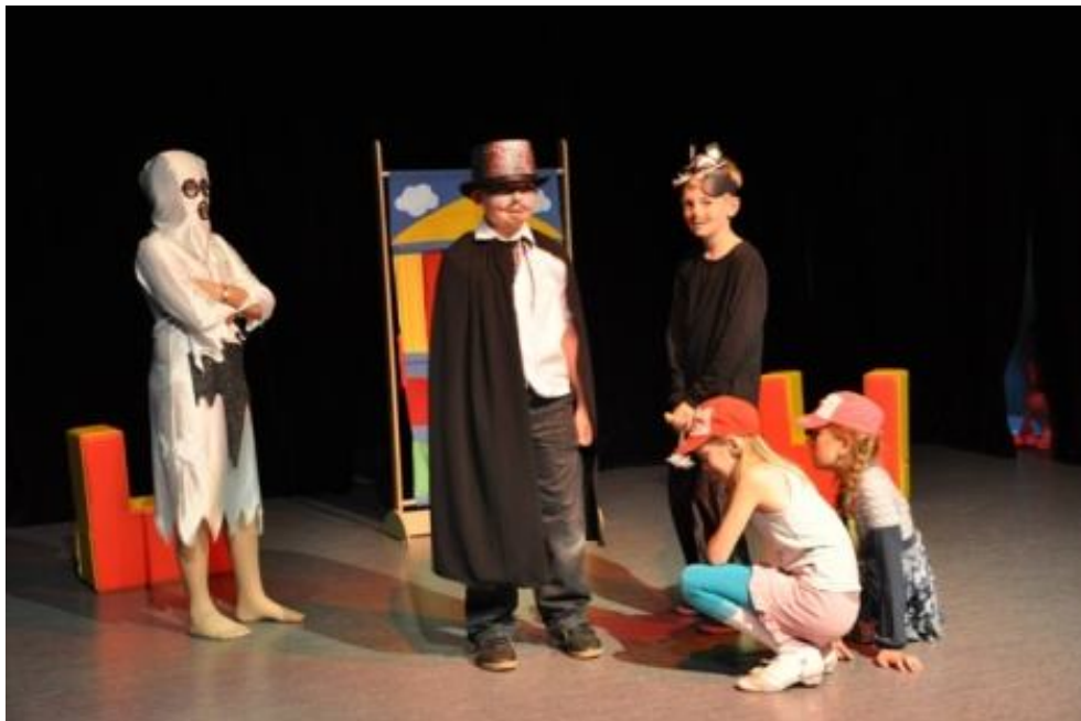
Zespół BAJKA z Publicznej Szkoły Podstawowej im. Władysława Rosłońca w Przybyszewie Spektakl pt.: „Wyczaruję Wam”