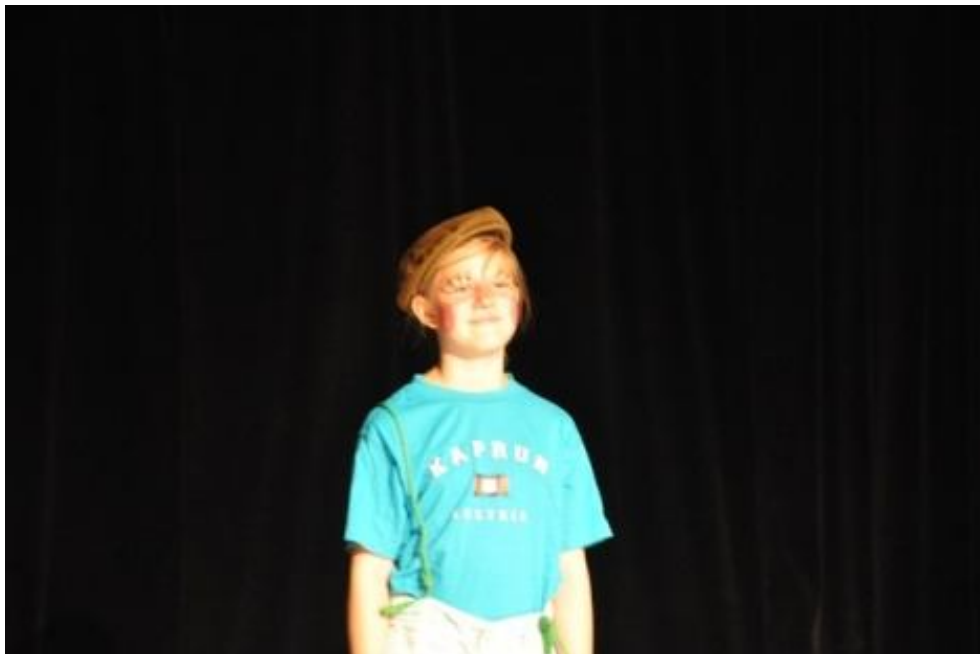
Zespół BEZ NAZWY z Prywatnej Szkoły Podstawowej nr 114 w Warszawie Spektakl pt.: „Pinokio”