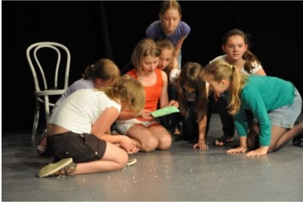
Zespół BAJKOWE LUDKI z Publicznej Szkoły Podstawowej im. Jana Kochanowskiego w Zakrzewie Spektakl pt.: „Niby magia”