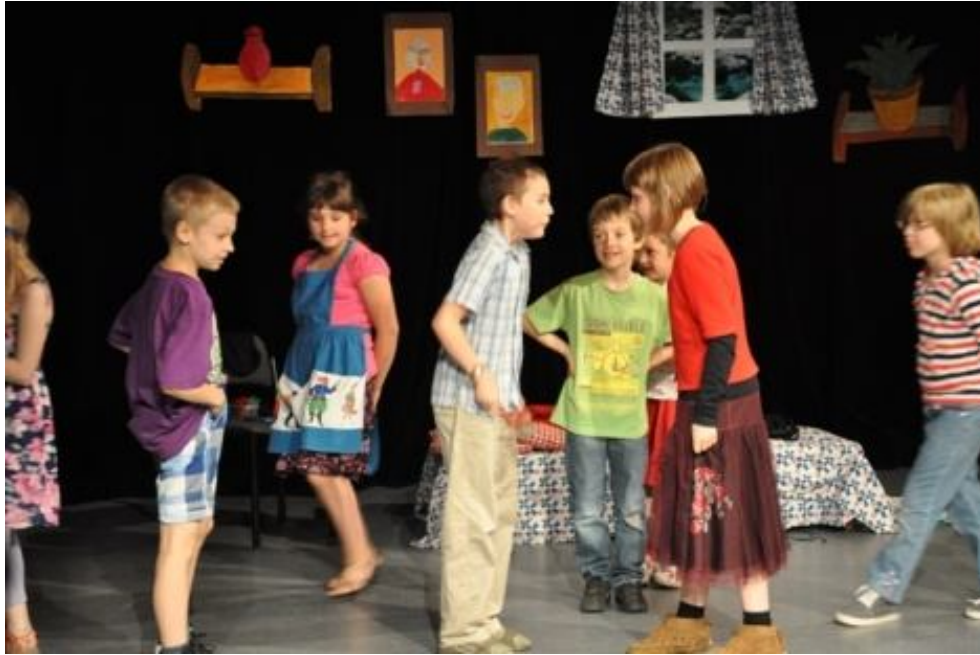
Zespół TEATRZYK Z BIEDRONKOWA ze Świetlicy przy Szkole Podstawowej nr 23 w Warszawie Spektakl.: „Panienka pod lupą...”