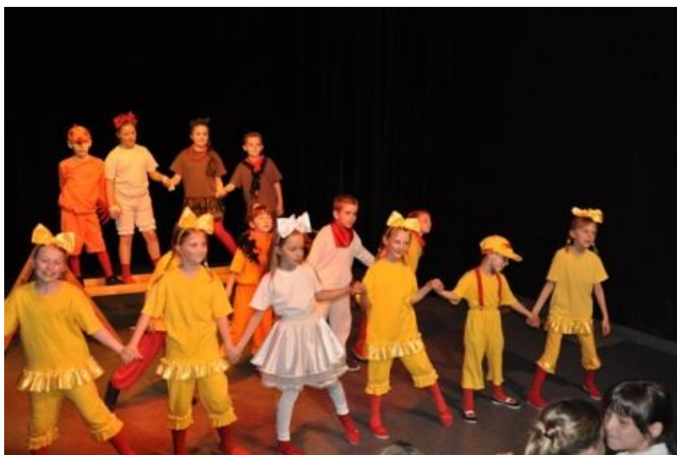
Zespół SUPEŁEK ze Szkoły Podstawowej z Oddziałami Integracyjnymi w Siedlcach Spektakl pt.: „Brzydkie kaczątko”

Poniżej prezentujemy zdjęcia finałowych spektakli i pełny Werdykt Jury.