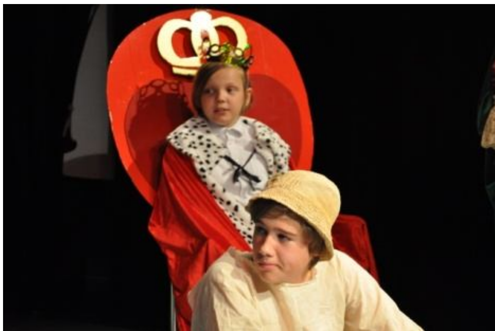
Zespół TEATR OPTYMISTYCZNY z Zespołu Szkół nr 4 w Słomczynie Spektakl pt.: „Za ósmą górą”