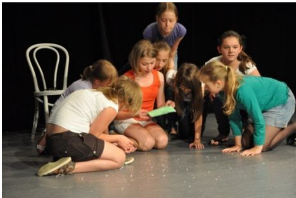
Zespół BAJKOWE LUDKI z Publicznej Szkoły Podstawowej im. Jana Kochanowskiego w Zakrzewie Spektakl pt.: „Niby magia”