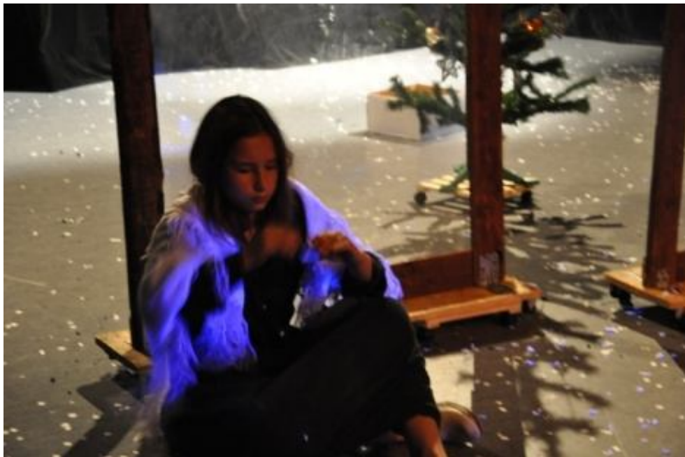
Zespół TEATRZYK HORROREK z Zespołu Szkół w Nowej Iwicznej Spektakl pt.: „Dziewczynka z zapalkami”