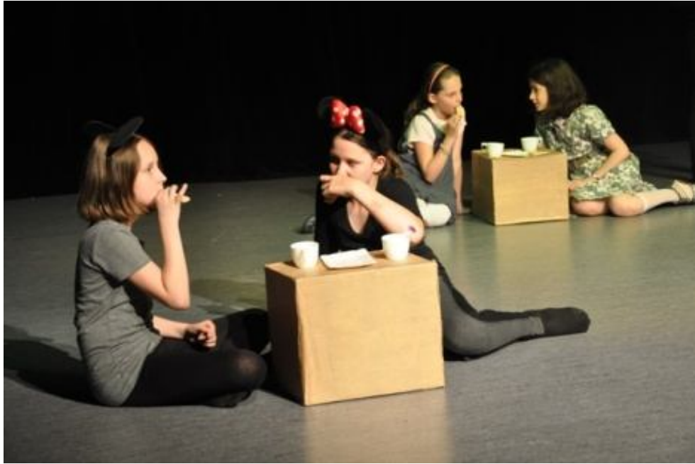
Zespół TEATR AKTYWNY AKCENT ze Szkoły Podstawowej nr 225 w Warszawie Spektakl pt.: „Dwie parafrazy bajki dla dzieci”