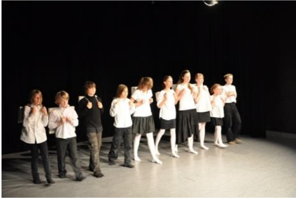
Zespół TEATR MAKADAMIA ze Społecznej Szkoły Podstawowej nr 14 w Warszawie Spektakl pt.: „Sztuka latania”