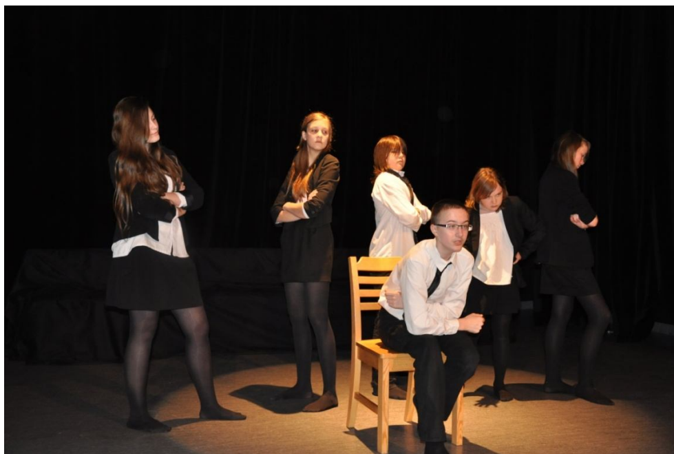
Zespół „Teatr Makademia” ze Społecznej Szkoły Podstawowej Integracyjnej nr 12 im. Emanuela Bułhaka Spektakl pt.: „Kiedy będę dorosły”