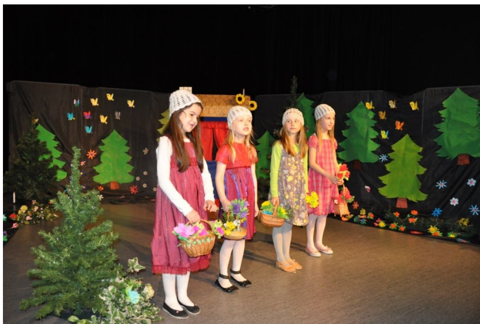
Zespół „Teatr Bez Nazwy” ze Szkoły Podstawowej Integracyjnej nr 339 Spektakl pt.: „O Babci, Wilku i Kolorowych Czapeczkach”