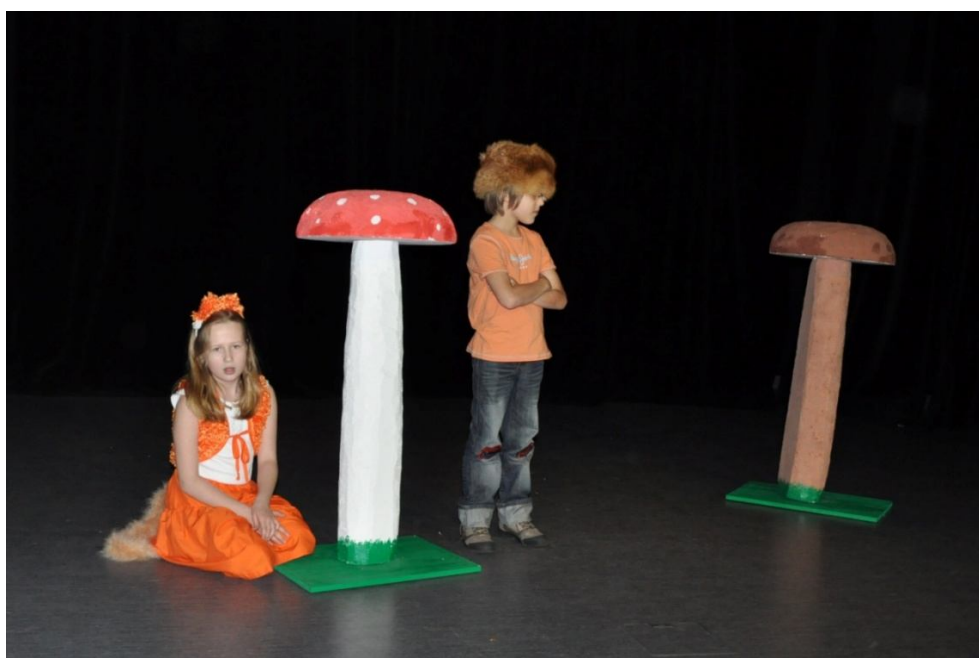
Zespół „Węzelek” ze Szkoły Podstawowej nr 94 im. I Marszałka Polski Józefa Piłsudskiego Spektakl pt.: „Pod - Grzybek”